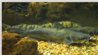
Pez gato moteado

Se desenvuelve en masas acuáticas muy variadas desde tramos de corriente hasta charcas, lagos y embalses ya que puede tolerar una amplia gama de condiciones ambientales.