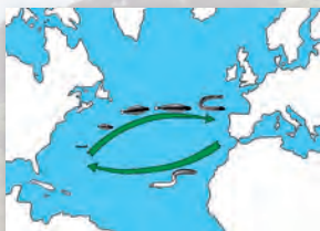
Ciclo de la anguila

Es un pez catádromo que se reproduce en el mar Caribe. Sus larvas son transparentes y nadan miles de kilómetros, ayudados por la corriente del Golfo, hasta llegar a los ríos de donde partieron sus progenitores.